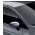
Techo Gris Casiopea (M)