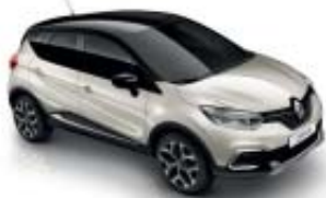
Marfil Delhi (OE) Techo Negro Brillante (M)