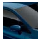
Techo Azul Ocean (M)