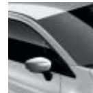
Techo Gris Platino (M)