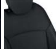
Tapicería tejido Carbono Oscuro