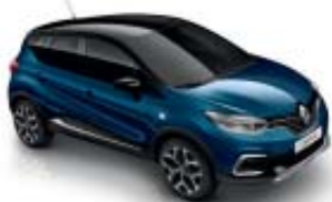
Azul Ocean (M) Techo Negro Brillante (M)