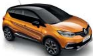
Naranja Atakama (ME) Techo Negro Brillante (M)