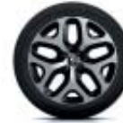
Llanta de aleación de 43 cm (17") Emotion Diamantada Negra