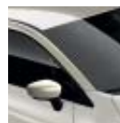
Techo Marfil Delhi (OE)

(M) Metalizados (ME) Metalizada Especial (OE) Opaca Especial (O) Opaca