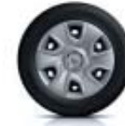
Embellecedor 41 cm (16") Victoria