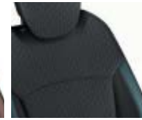
Tapicería desenfundable Azul Ocean