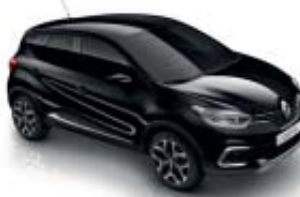
Negro Brillante (M) Techo Negro Brillante (M)