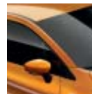
Techo Naranja Atakama (ME)