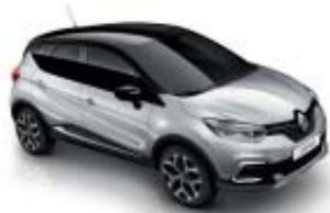
Gris Platino (M) Techo Negro Brillante (M)