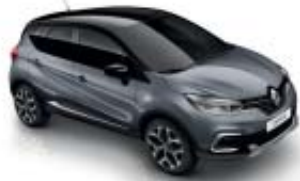
Gris Casiopea (M) Techo Negro Brillante (M)