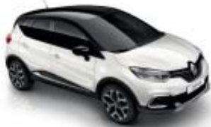
Blanco Nacarado (ME) Techo Negro Brillante (M)