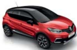
Rojo Deseo (ME) Techo Negro Brillante (M)