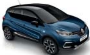
Azul Volga (O) Techo Negro Brillante (M)