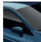
Techo Azul Volga (O)