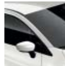
Techo Blanco Nacarado (ME)