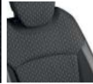
Tapicería desenfundable Marfil