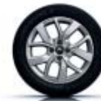
Llanta de aleación 41 cm (16") Celsium