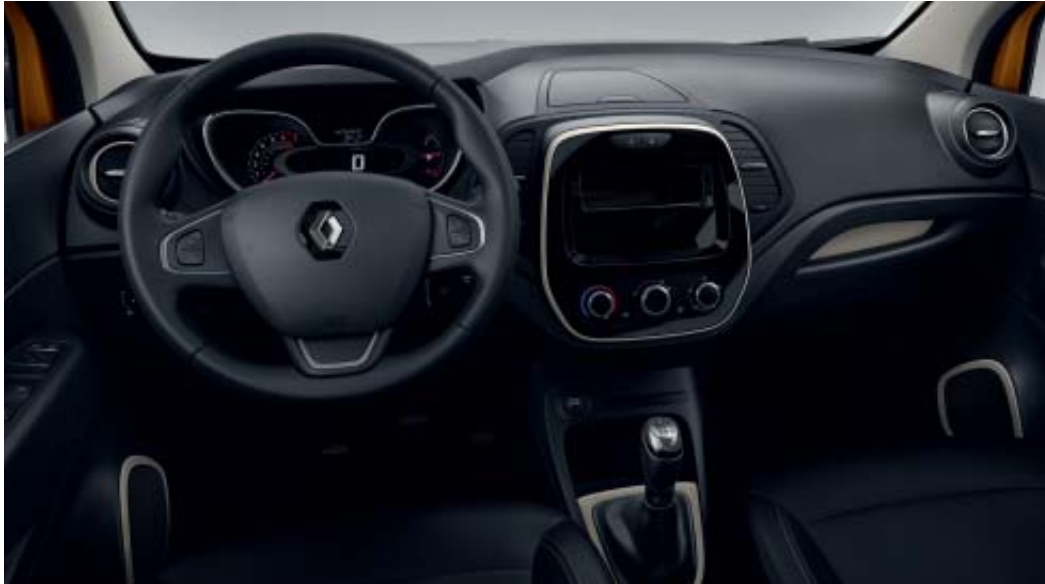
Ambiente interior oscuro