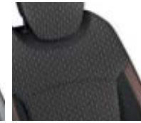
Tapicería desenfundable Naranja